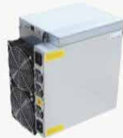
BITMAIN ANTMINER S17+