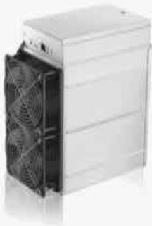
BITMAIN ANTMINER Z11