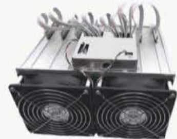
DAYUN ZIG Z1 PRO